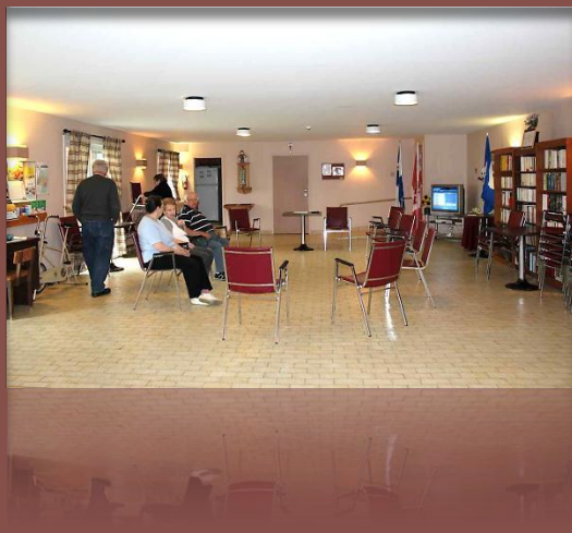
Salle communautaire de la résidence en participation avec le club des aînés

Il avait été entendu avec la centrale que le plancher de la salle communautaire ne soit pas inclus dans le coût des travaux. Il avait été entendu que le club de l'âge d'or prendrait à charge la construction de ce plancher. Une résolution du conseil d'administration de la résidence confie la construction dudit plancher au club de l'âge d'or de Saint-Marc sans spécifier quelle corporation procéderait au paiement des travaux. Le conseil suggère un plancher à moindre coût construit en bois franc.