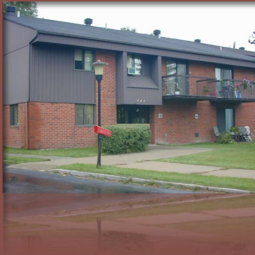
L'entrée principale de la résidence